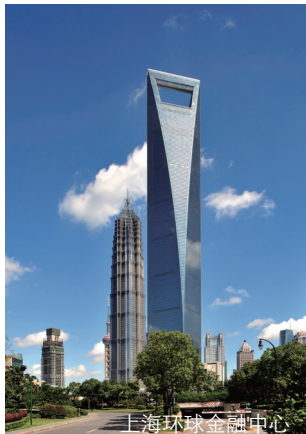
上海环球金融中心