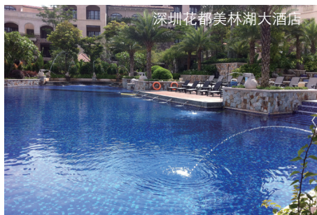
深圳花都美林湖大酒店