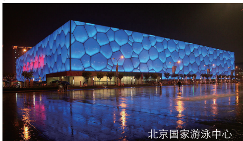
北京国家游泳中心