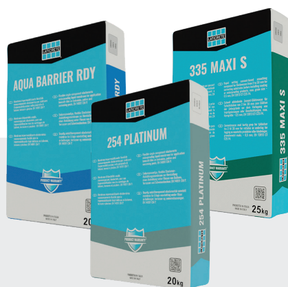
Colles pour carreaux céramiques et produits pour la protection des surfaces en ciment