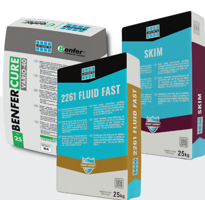
Mortiers et chapes