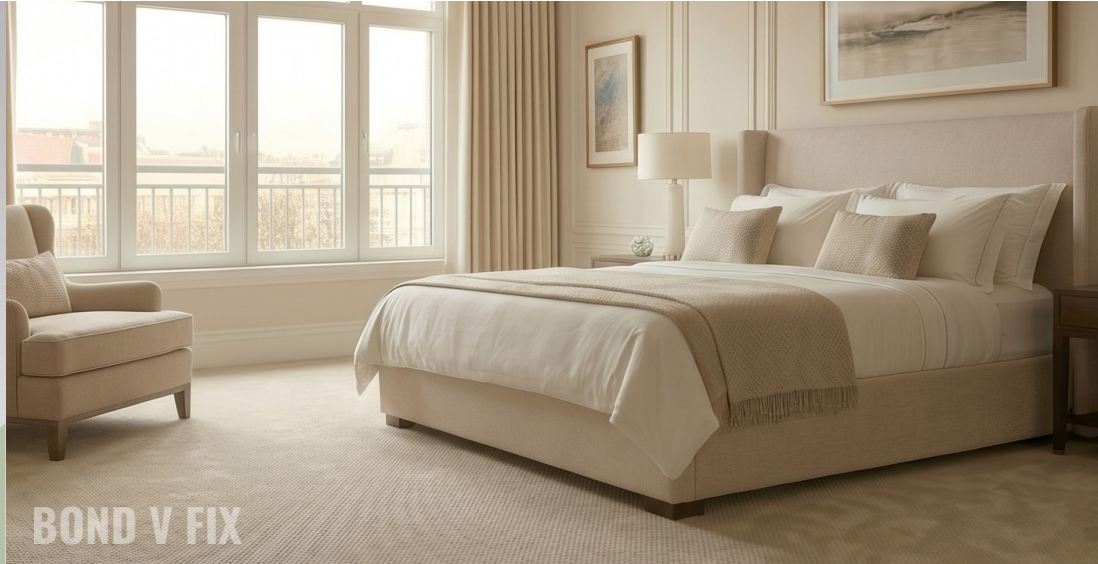
BOND V FIX