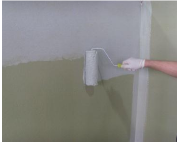
图 3.3.1 墙面防水涂刷

待节点处理的防水层表面指触不粘，即可以开始进行大面积涂刷管不漏。大面积涂刷应分多次涂刷，单次涂刷厚度控制在 0.2mm~0.4mm。待上一遍材料表干（指触不粘手）后即可进行下一遍涂刷，相邻两次涂刷需要按照十字交叉的方向进行。防水材料涂刷完成后的最终厚度应控制在 0.5mm~0.8mm。