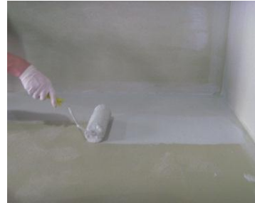
图 3.3.2 地面防水涂刷