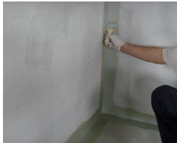
图 3.2.1 阴角节点处理

即使墙面无防水要求时，地面的防水涂层也应沿墙面垂直方向往上涂刷至少 100mm。