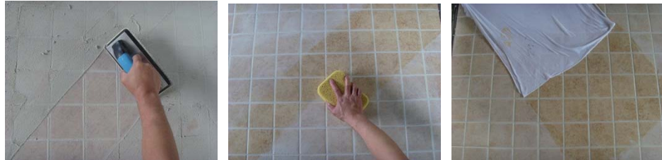
图 10-图 11 填缝剂清洗