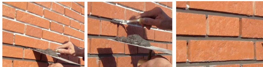
图 7-图 9 喂缝法

该方法主要用于表面粗糙的瓷砖或石材填缝, 以及瓷砖石材颜色要求保持原色等场合。该方法能避免填缝过程中填缝剂污染面材表面。该方法施工过程需严格进行, 特别是将填缝剂填充致密, 否则后期容易出现泛碱等问题。