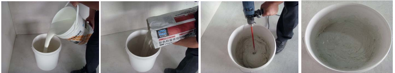
图 3-图 6 材料制备

按比例称取需要的粉料与 1776 填缝添加剂(或水), 先将液体添加剂倒入搅拌桶内, 然后将雷帝 1300 通用彩色填缝剂粉料倒入搅拌桶内, 用低速电动搅拌器将二者搅拌均匀, 静置约 5 分钟后再稍加搅拌即可使用。如图 3-图 6