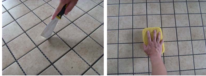
图 1-图 2 表面清理