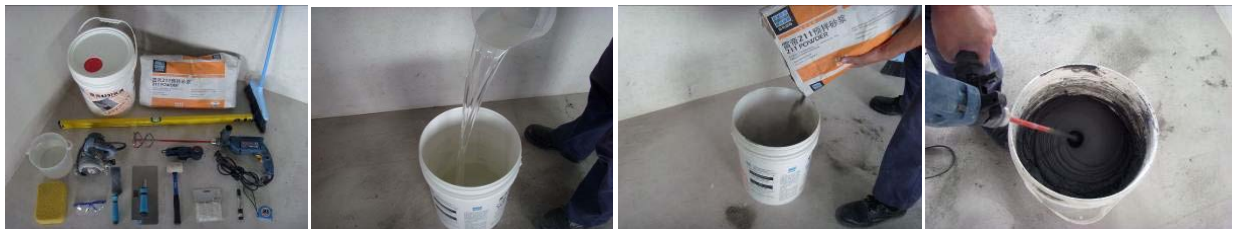
图 5-图 8 材料制备