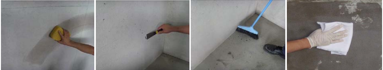
图 1-图 4 基层处理