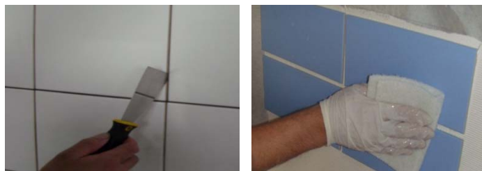
图 15-16 缝隙及表面清洁

在面材粘贴前发现表面被污染, 应及时清理; 在粘贴后发现面材表面被污染, 应在不会造成面材位移的前提下, 轻轻擦拭掉污物; 如果采用清洁剂清洗的话, 应在施工全部完毕 7 天后, 采用中性清洁剂进行彻底清洁清洗。清洁工具和清洁剂的选择请按照面材供应商及清洁剂供应商提供的操作指南。