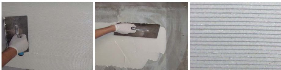
图 9-图 11 胶粘剂施工