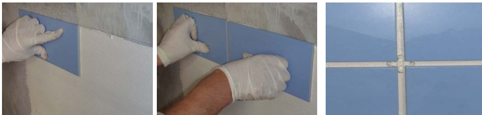
图 12-14 面材安装