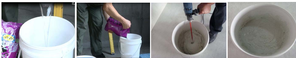
图 3-图 6 材料搅拌