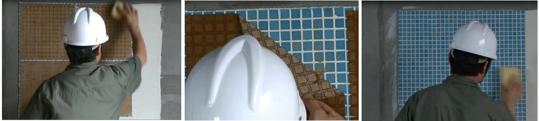
图 11-图 13 清洗