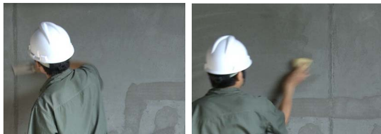
图 1-图 2 表面清理