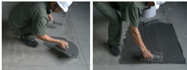
图 9-图 10 胶粘剂施工