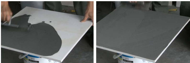
图 11-图 12 人造石背涂