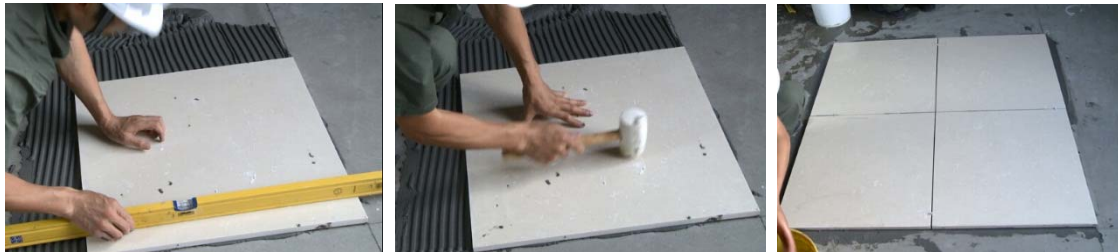
图 13-15 人造石安装