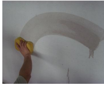
图 3.1.2 使用海绵清理基层