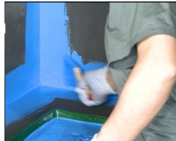
图 3.2.2 阴角预处理