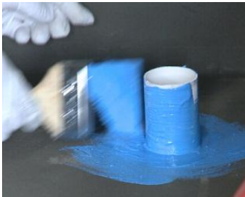
图 3.2.1 管根预处理

即使墙面无防水要求时，地面的防水涂层也应沿墙面垂直方向往上涂刷至少 100mm。