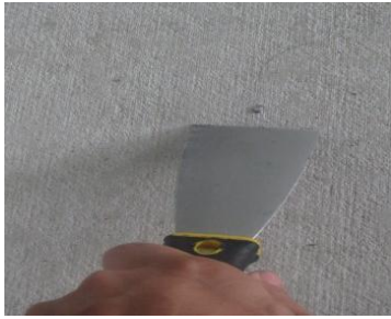
图 3.1.1 使用灰油铲去除基层污渍