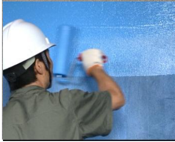
图 3.3.1 墙面防水涂刷

邻两次涂刷需要按照十字交叉的方向进行。防水材料涂刷完成后的最终厚度应控制在 0.5mm~0.8mm。