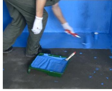
图 3.3.2 地面防水涂刷