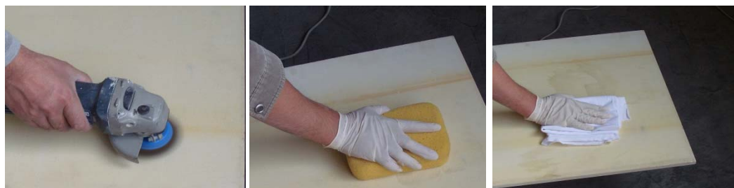
图 5-图 7 面材处理