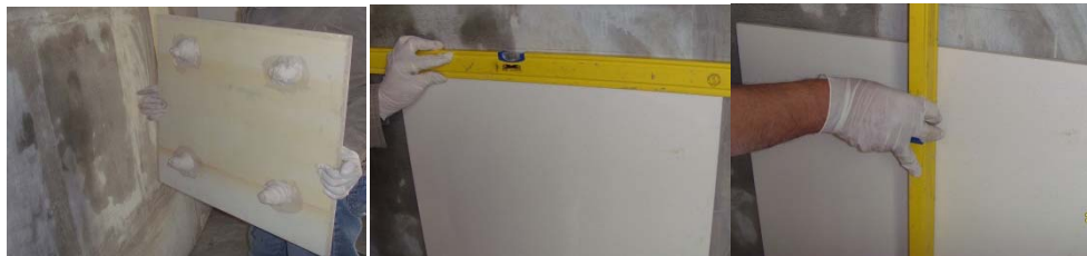
图 16-图 18 安装及调整