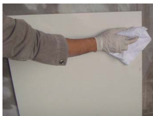
图 19 面材清理