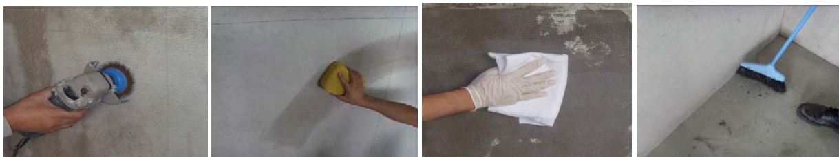
图 1-图 4 基层处理