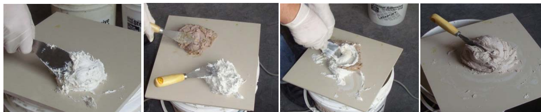
图 8-图 11 材料制备