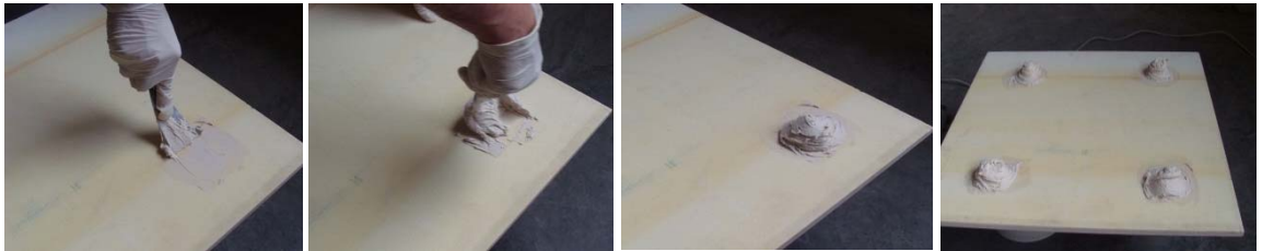
图 12-图 15 涂抹胶粘剂

每点处粘结剂厚度在 3-25mm 之间；按照要求，胶粘剂与面材实际粘贴的面积不能低于面材总面积的 10%。胶粘剂涂抹时，首先应取少量胶粘剂来回地在面材上揉搓，使得面材粘结点上薄薄地覆盖上一层胶粘剂。这样做的目的是使粘结剂和面材充分接触。然后取多一点料将胶粘剂揉成塔状。注意要求的每个点的胶粘剂的高度和直径。上述步骤完成后，应立即安装。