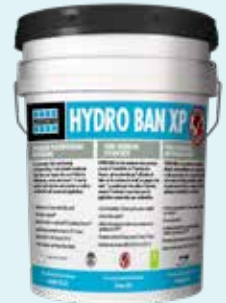
Data Sheet DS-36642