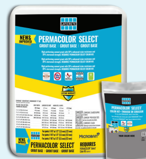
La fiche technique 281.0