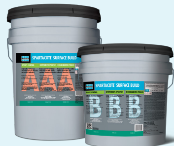
Fiche technique 36644