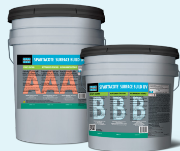
Data Sheet 36645