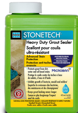
Data Sheet 295

Cement-based (sanded and non-sanded) grout for natural stone, ceramic and porcelain tile.